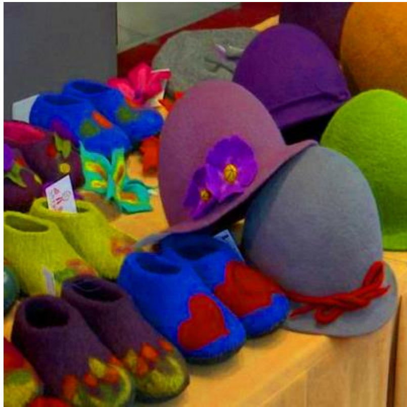
Պրոբացիայի շահառուների կողմից պատրաստված իրեր