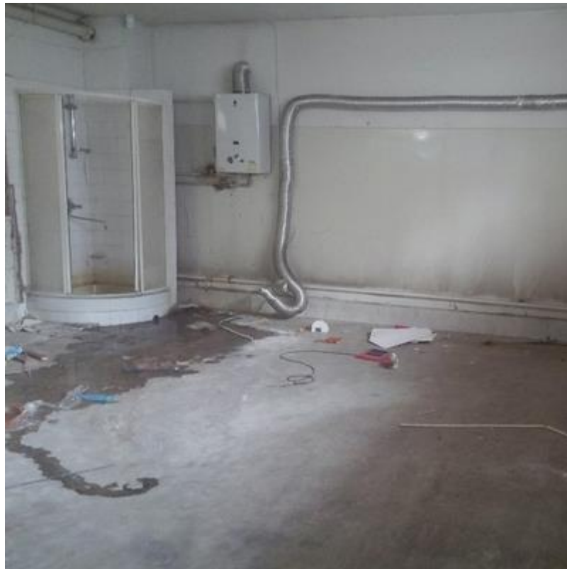
Լուսանկարչության դասասենյակ (առաջ և հիմա)