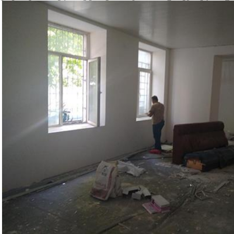
Համակարգչային դասասենյակ (առաջ և հիմա)