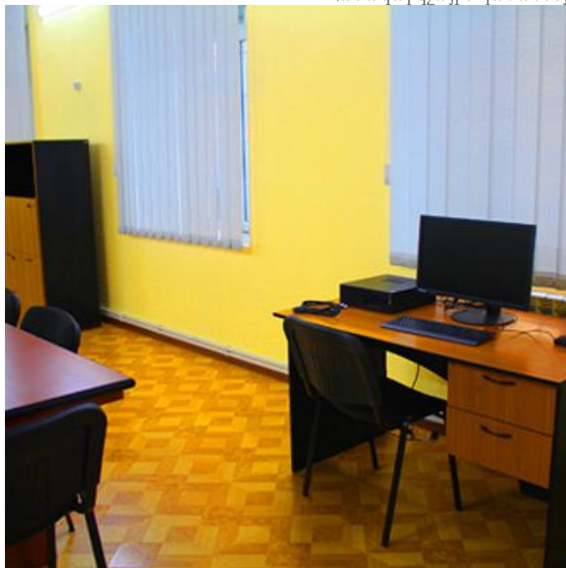
Հոգեբանի սենյակ (առաջ և հիմա)