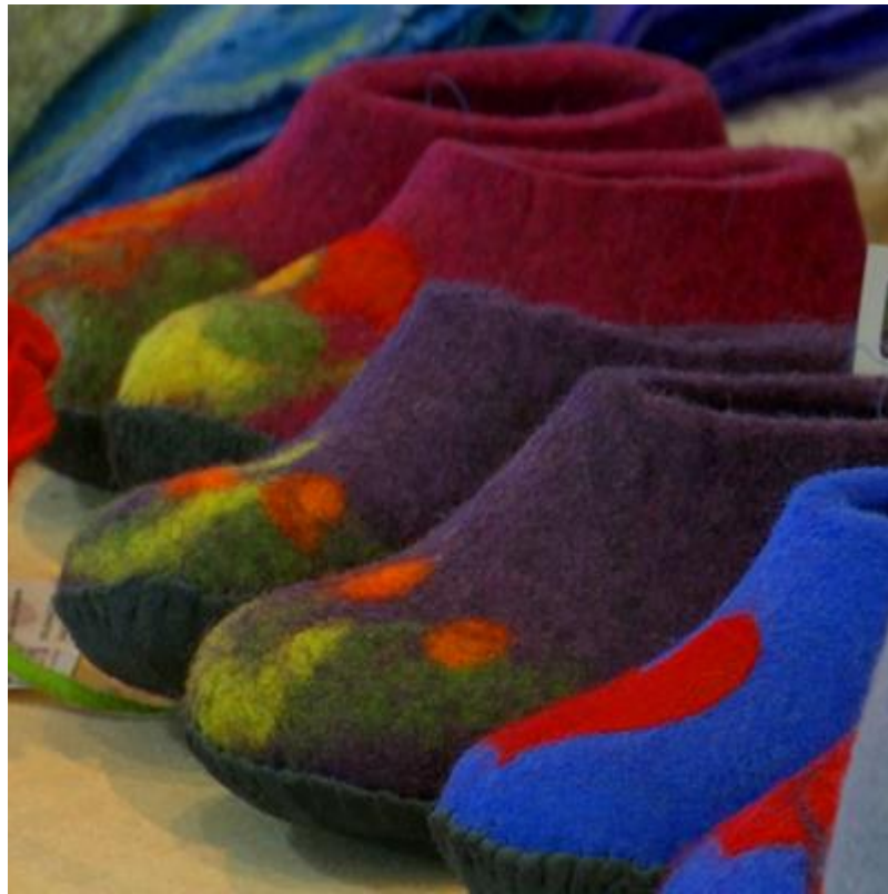
Պրոբացիայի շահառուների կողմից պատրաստված իրեր