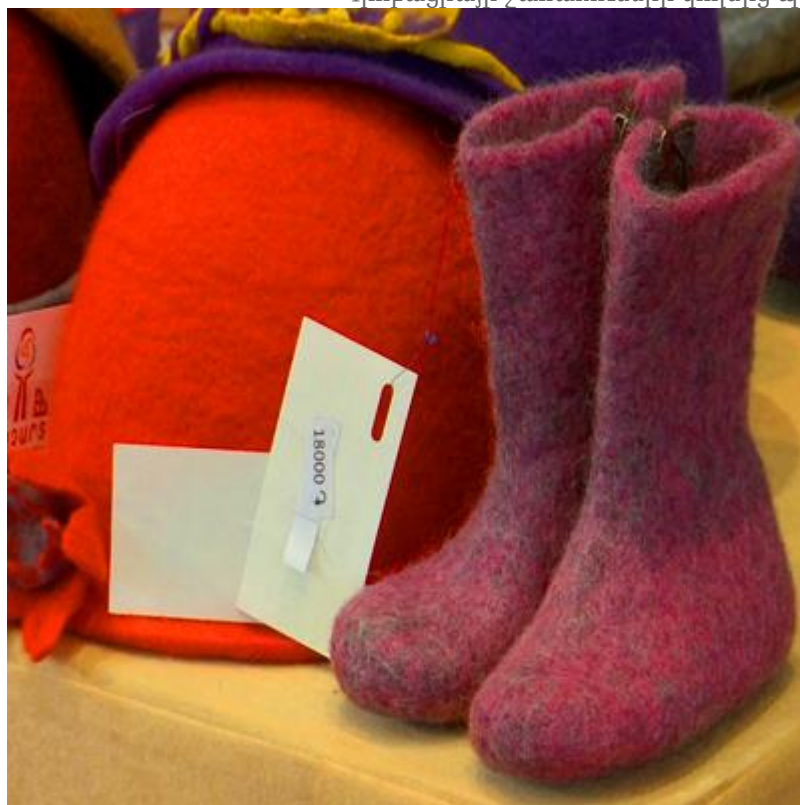
Պրոբացիայի շահառուների կողմից պատրաստված իրեր