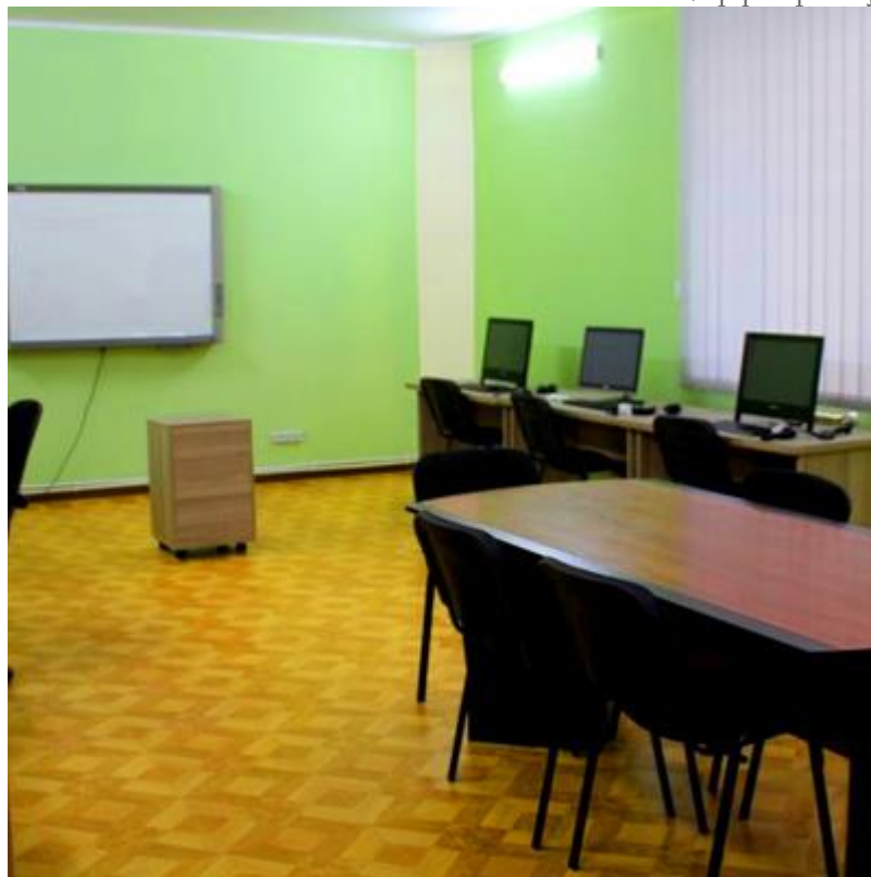
Լուսանկարչության դասասենյակ (առաջ և հիմա)