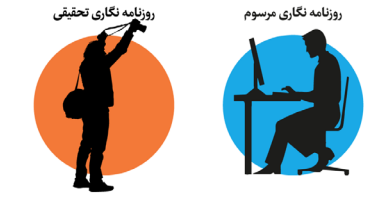
روزنامه نگاری تحقیقی