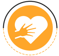
سوء استفاده عاطفی

«سوء استفاده عاطفی یک حمله پایدار به اعتماد به نفس یک کودک یا نوجوان است. می‌تواند شامل صدازدن با نام‌های مختلف، تهدید، خجالت‌زده ساختن، ترساندن یا جدا کردن کودک یا نوجوان باشد.»