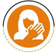
سوء استفاده جسمانی

«سوء استفاده جسمانی زمانی رخ می‌دهد که یک فرد عمداً کودک یا نوجوان را آسیب می‌رساند یا تهدید به آسیب وارد کردن به او می‌کند. این شامل سیلی زدن، لگد زدن، تکان دادن، پا زدن، سوزاندن، هل دادن یا گرفتن است. آسیب ممکن است به صورت کبودی، بریدگی، سوختگی یا شکستگی باشد.»