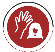
سوء استفاده جنسی

«سوء استفاده جنسی به بهره‌برداری جنسی واقعی یا احتمالی از یک کودک اشاره دارد. سوء استفاده جنسی شامل تجاوز، اذیت جنسی و هر نوع فعالیت جنسی می‌شود که کودکان در آن وارد می‌شوند. از جمله استفاده از کودکان برای تهیه عکس‌های پورنوگرافیک یا نشان دادن این نوع عکس‌ها به کودکان.»