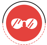
نادیده گرفتن غفلت کردن

«این نوع سوء استفاده از طریق نادیده گرفتن و یا غفلت کردن در تامین نیازهای اساسی کودک مانند غذا، لباس، محل اقامت و نظارت از وجود هر نوع خطر به سلامت و توسعه کودک می‌باشد»